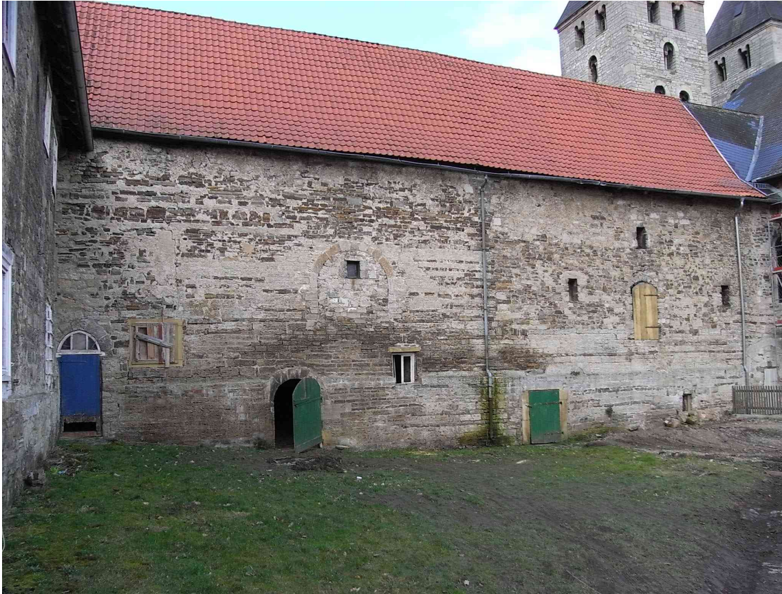
Westflügel Ostseite Ansicht 2008