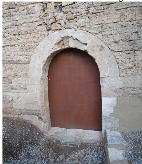
Restauriertes Portalgewände mit Wassereinlauf und Eichenholztür, November 2019.