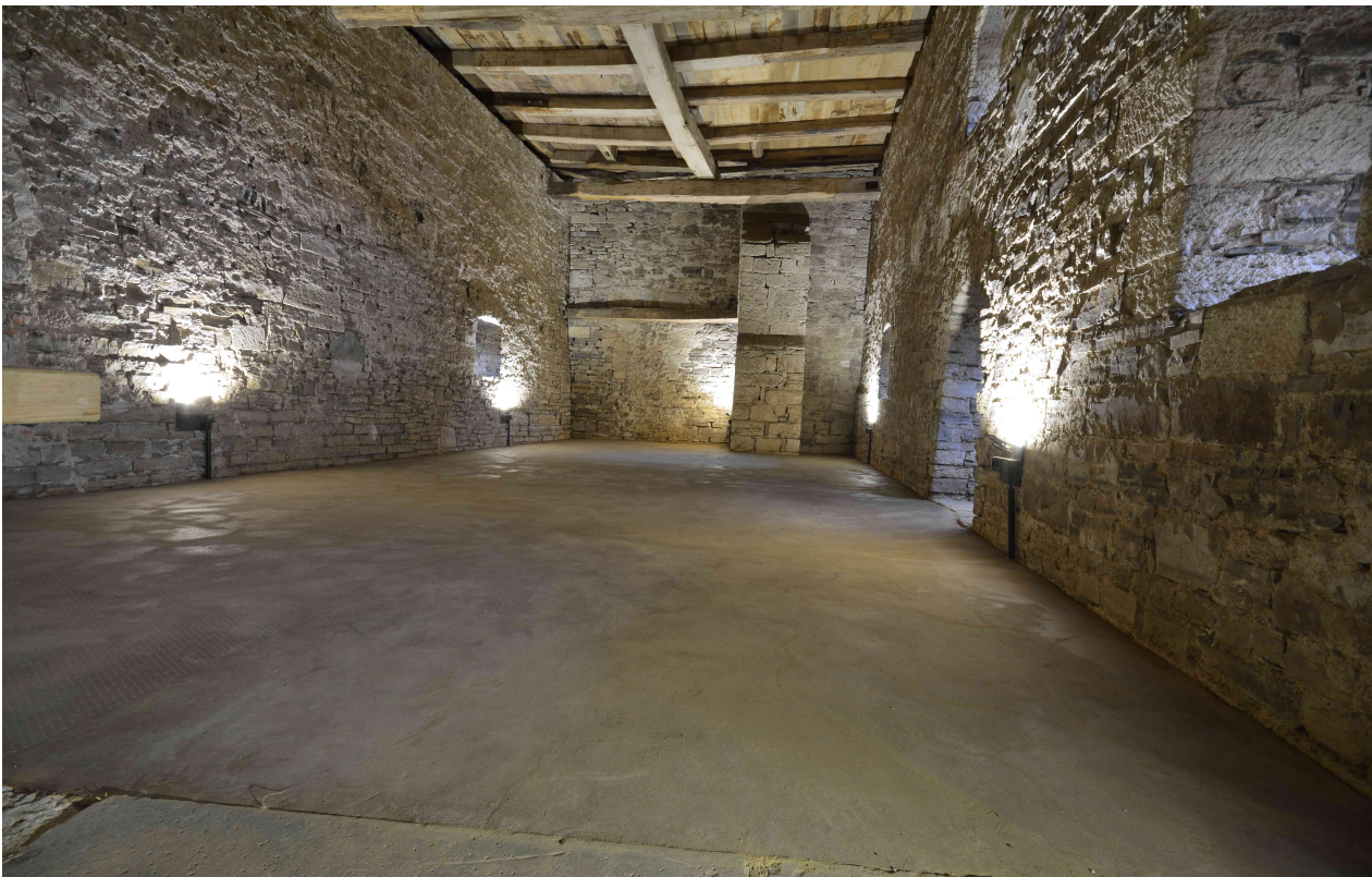
Der egalisierte Lehm Boden wertet den Raum auf.