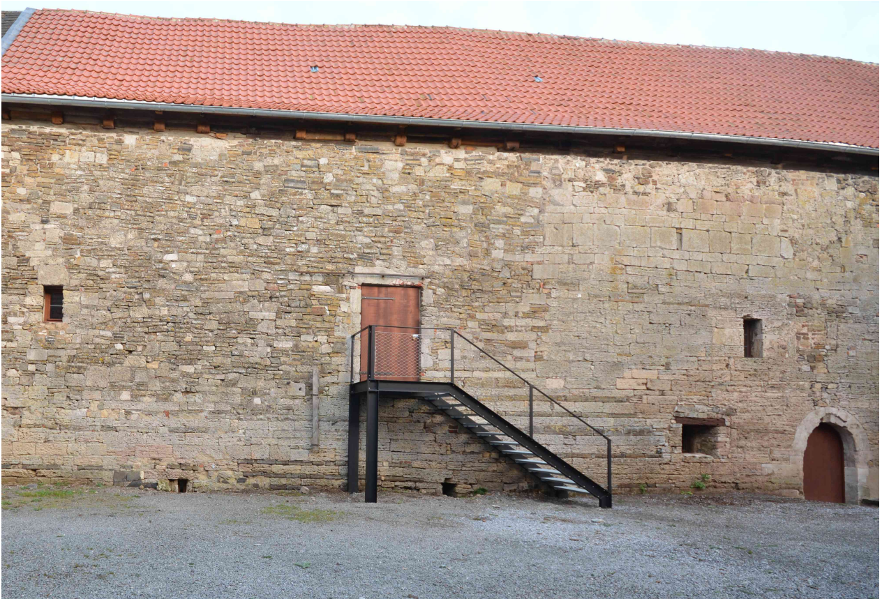
Die neue Außentreppe ermöglicht einen sicheren Zugang.