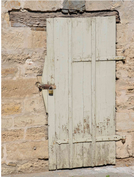
Türsturz faul, Tür schadhaft.