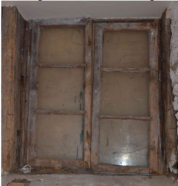
Undichtes Fenster im Haustechnikraum.