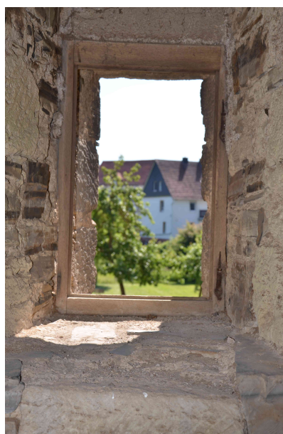
Der Fensterflügel fehlt.