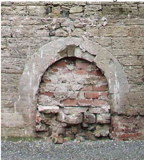
Stark geschädigtes Westportal, Zustand 2014.