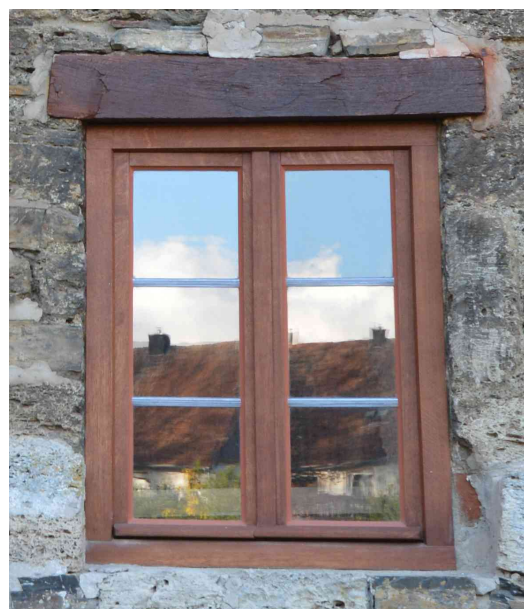
Zustand nach Restaurierung.