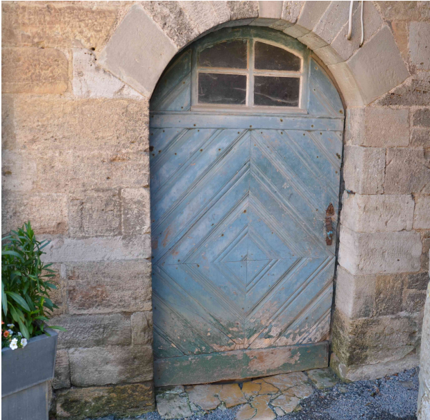
Tür von 1872, Lindenholz im unteren Teil stark geschädigt unterschiedliche Farbfassungen.