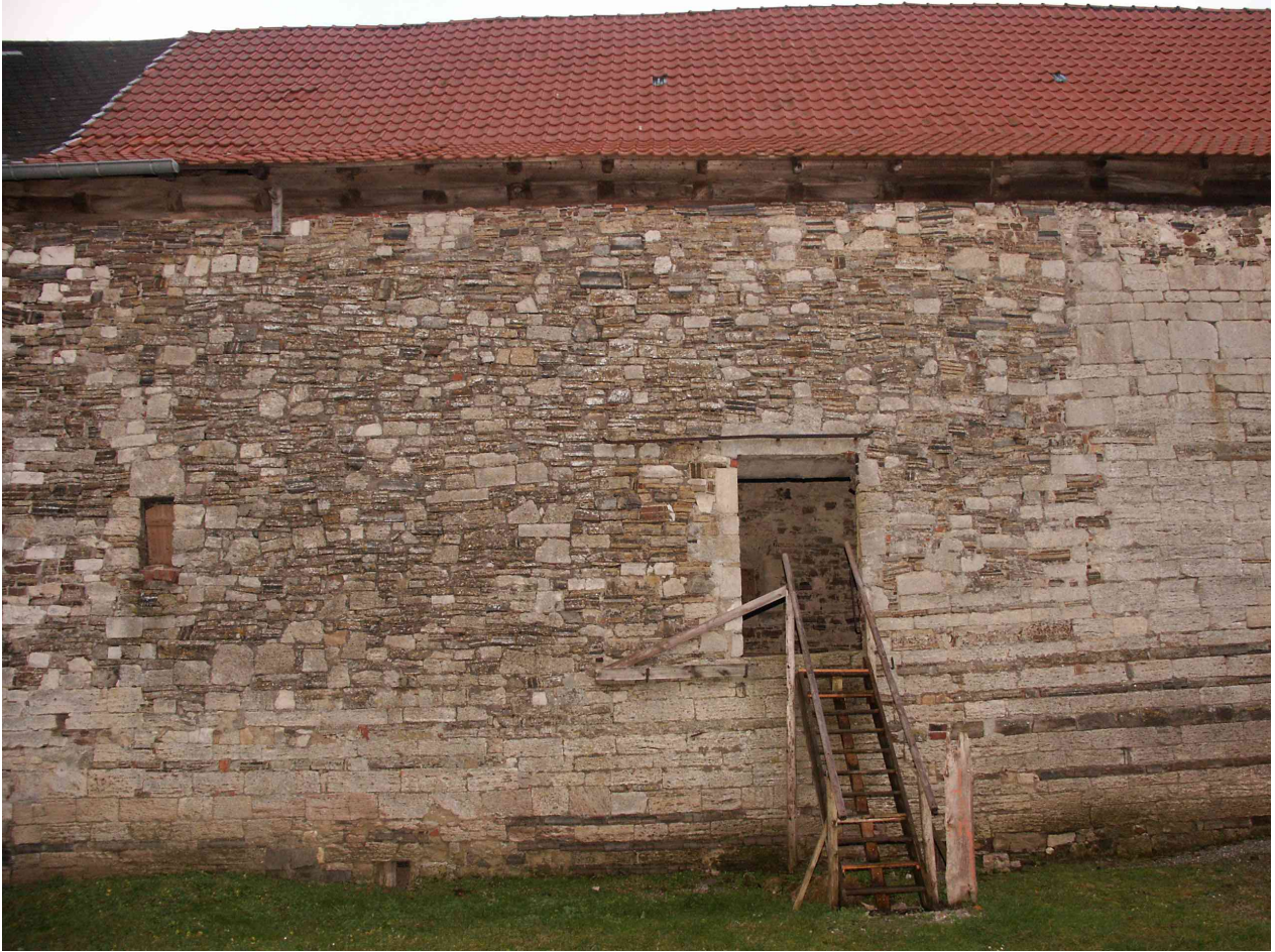
Provisorischer Zugang zum ehemaligen Dormitorium beim Klostertag 2008.