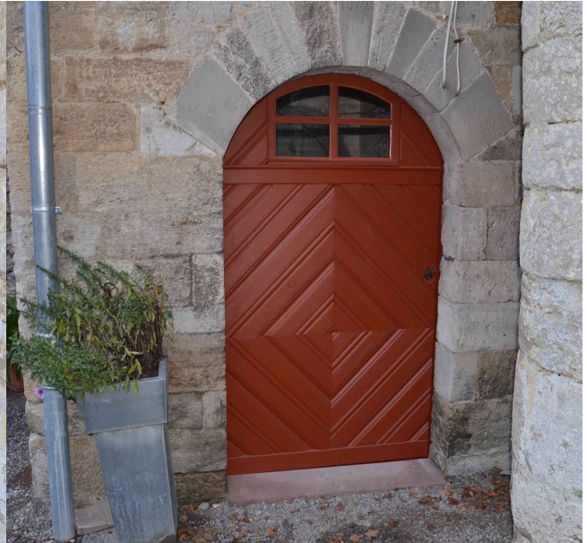
Restaurierte Tür, Schwelle erneuert.