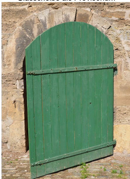
Ostportal mit Behelfstür