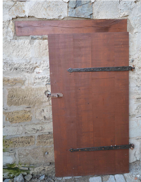
Tür und Sturz erneuert.