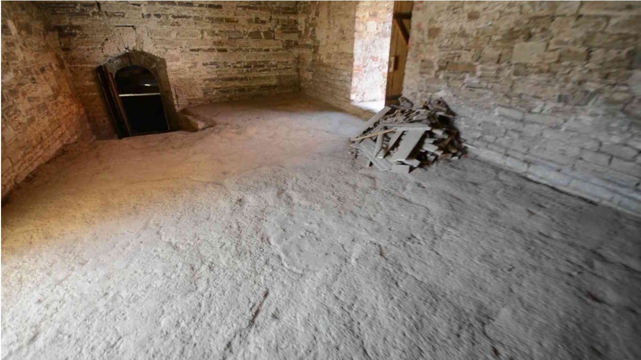
Westseite des unebenen Lehmbodens vor der Ausbesserung..