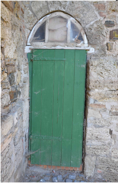
Provisorische Eingangstür 2009