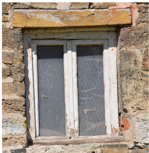
Schadhaftes Fenster mit Kunststoffscheiben.