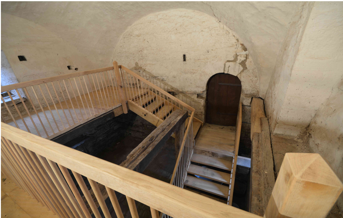
Die umgestaltete Galerie mit Treppen.