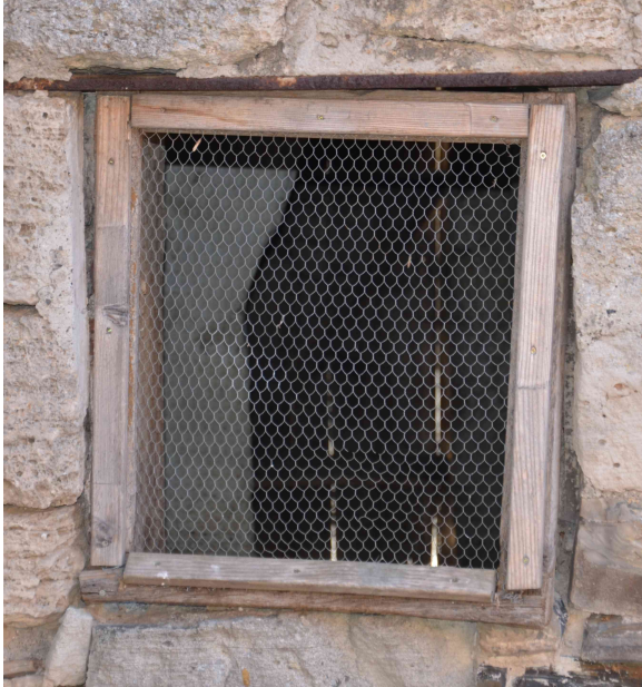
Offener Fensterrahmen mit Kükendraht.