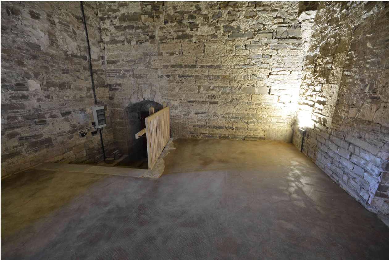
Egalisierter Lehmboden mit Treppenabgang und Absturzsicherung.