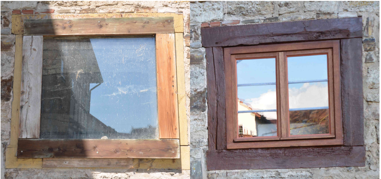
Glasscheibe als Provisorium