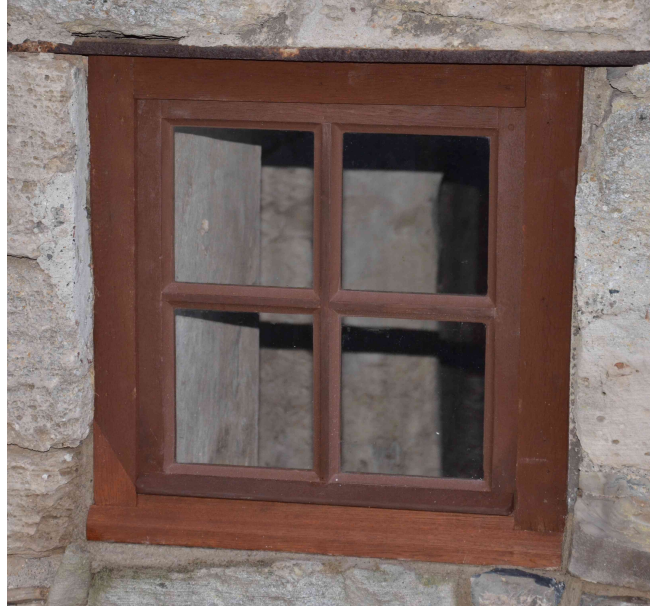
Zustand nach der Sanierung.