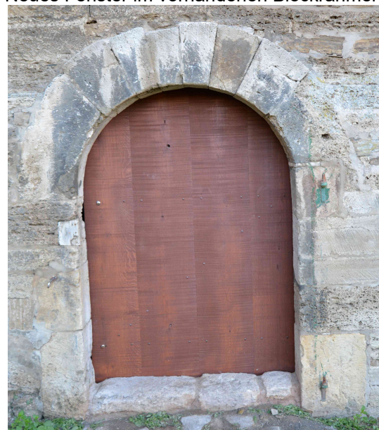
Zustand November 2019