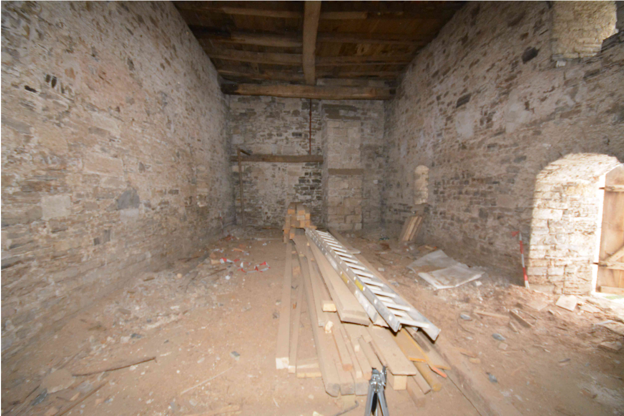
Blick in das ehemalige Dormitorium nach Abbau des Baugerüstes.