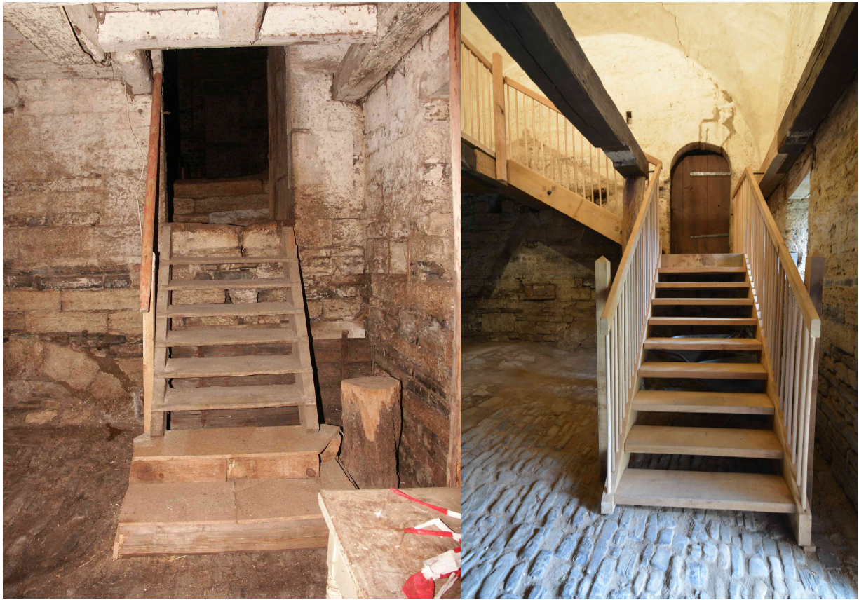
Das Treppenprovisorium wird durch eine neue Holzterapie beendet.