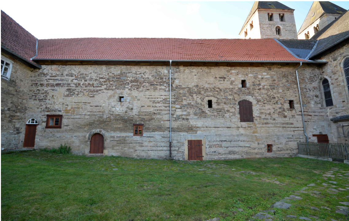
Westflügel im November 2019