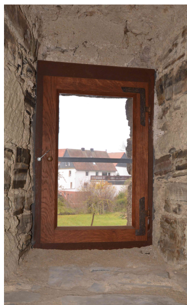
Das restaurierte Fenster.