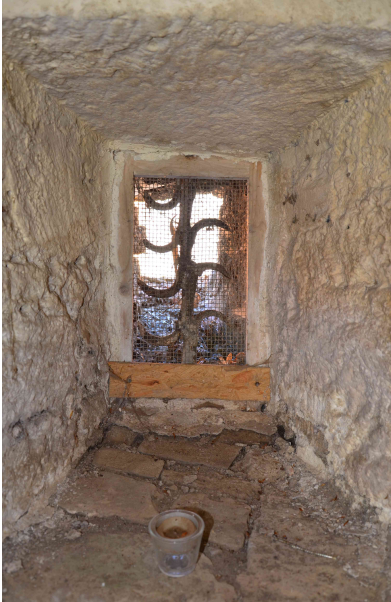
Offener Fensterrahmen im Untergeschoss.