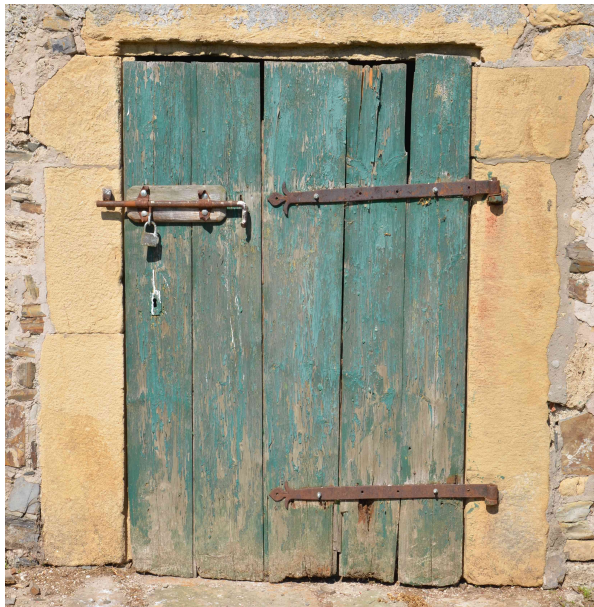
Eingangstür zum Untergeschoss.